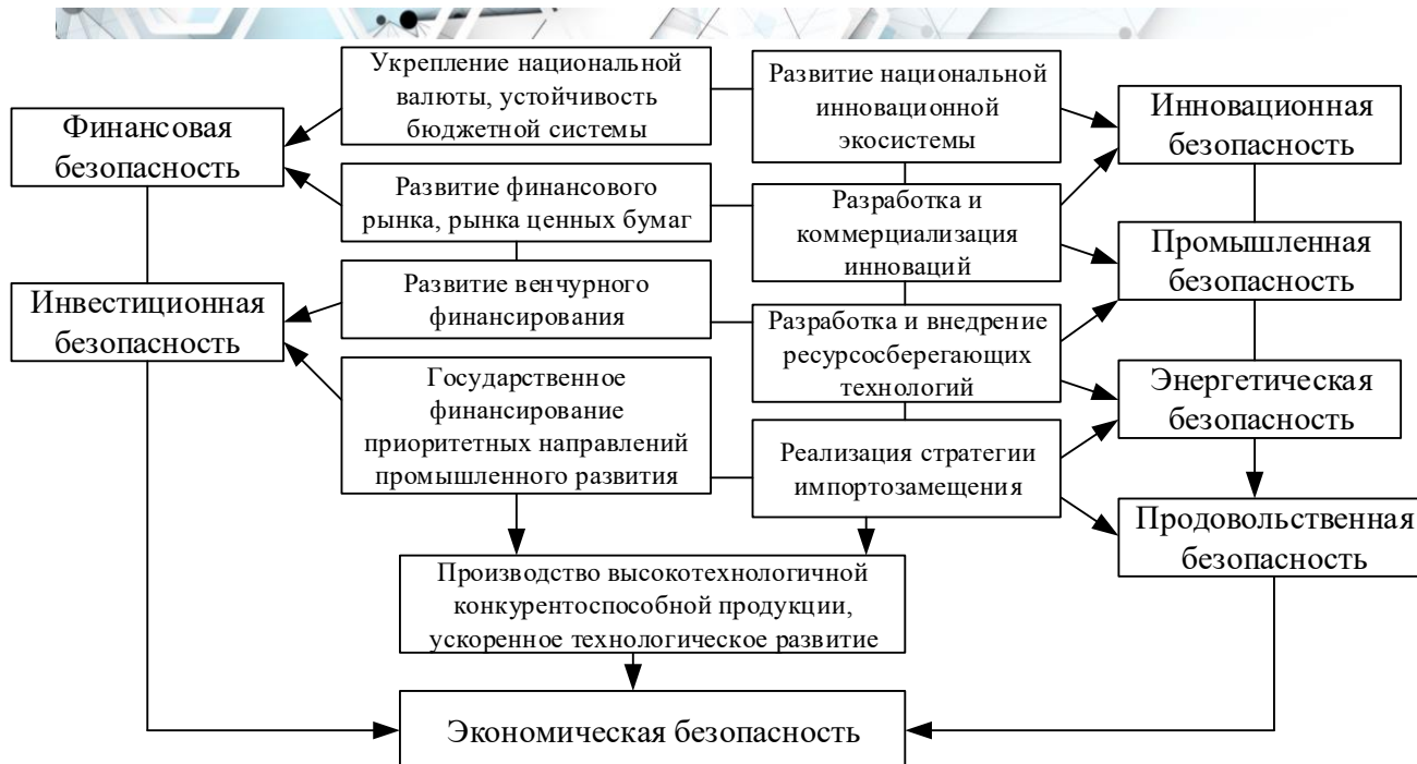
Рисунок 2 – Виды обеспечения экономической безопасности

Проведенный анализ подходов к определению экономической безопасности, сфер ее определения, критериев, показателей и других аспектов позволяет сделать следующие выводы. Несмотря на множество публикаций по данной тематике в научной литературе отсутствует единое понятие экономической безопасности, существуют лишь единообразные подходы, в рамках которых различные авторы тем или иным способом определяют данное понятие исходя из целей исследования. Это является справедливым, поскольку экономическая безопасность является многоаспектным понятием и в зависимости от рассматриваемого аспекта целесообразно уточнять трактовку данного понятия.