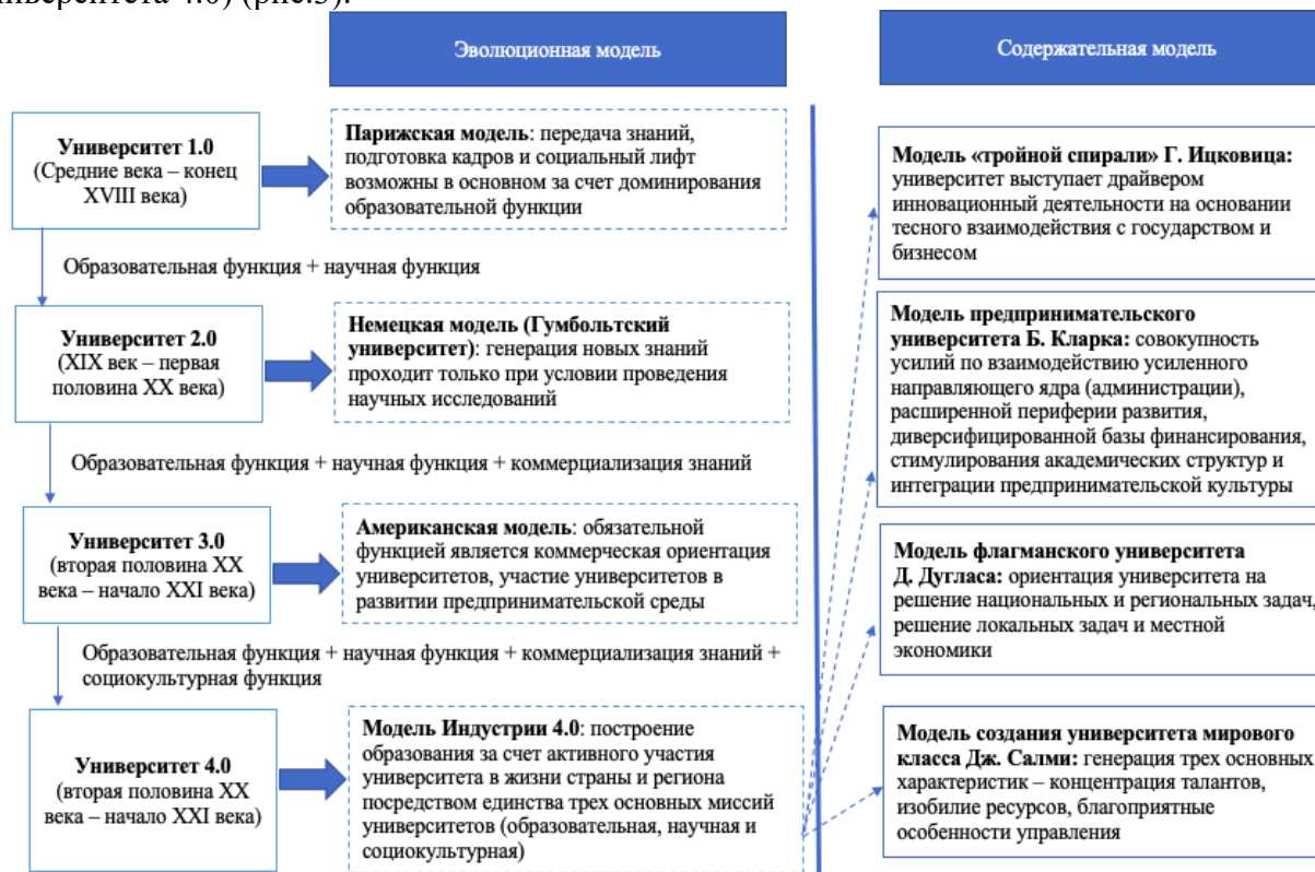
Рисунок 3 – Эволюционные и содержательные модели формирования университета мирового уровня [4]

Основопологающим в этом вопросе становится конкурентоспособности университета и возможные стратегии его развития, которые могут способствовать выходу университета на мировой уровень и формирование так называемого университета мирового уровня (прообраз Университета 4.0) (рис.3).